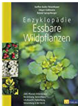
59 Euro, 4 Kilo schwer, Din A 3 ..