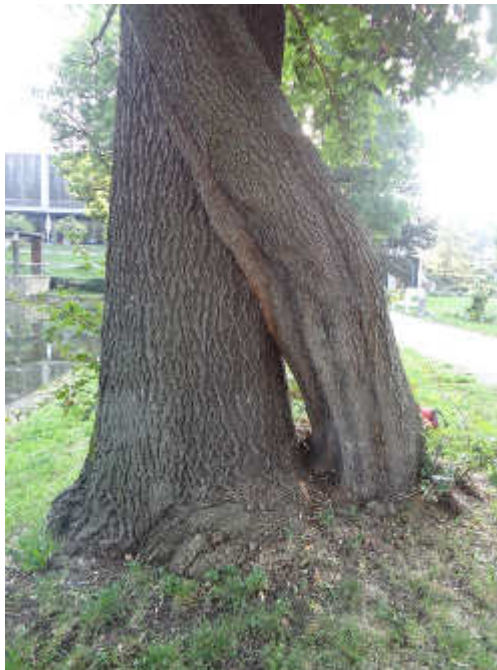
2 unterschiedliche Baumarten!