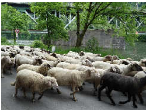
Die Retter der Ruhrauen! Hier an der Ruhr in Essen

Im Ruhrgebiet, wo die Herkulesstaude sich überall ausgebreitet hat, kann man im Sommer Tiere beobachten, die ebenfalls ihre Verehrung für dieses Kraut öffentlich zeigten. Eine Schafherde! Genüsslich und mit für Schafe erstaunlicher Geschicklichkeit wurden jeweils zu zweit (!) die zwei bis drei Meter langen Stängel nach unten gebogen, damit alle die süß-zarten weißen Blüten naschen konnten.