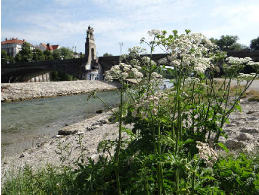
Bärenklau an der Isar ...

Mittlerweile mache ich „Liebeskräuter-Führungen“ nur noch dort, wo genug davon steht. Ich wusste vorher gar nicht, wie hoch der Bedarf an solch einer – bis vor kurzem für die Menschheit noch mehr oder weniger unbedeutenden – Pflanze sein kann.