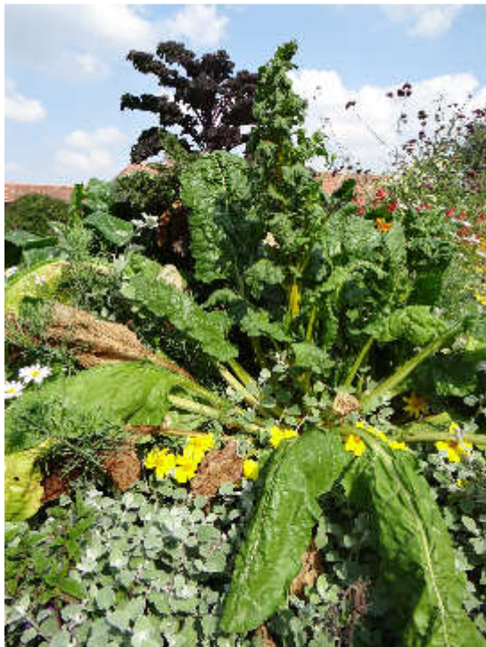
Vorne Mangold, hinten Grünkohl rotblättrig

Im folgenden Bild hat es der Grünkohl sogar in ein Zier-Staudenbeet geschafft! Am Schloss Belvedere in Weimar, das werden wir am 19.8. besuchen! Aber nicht naschen 😊