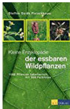
Kleine Enzyklopädie der essbaren Wildpflanzen

Schon seit mehreren Jahren schätze ich es sehr und schreibe ab März auch wieder jeden Monat mit großer Freude mit!! Und Guido Steffen Fleischhauer, den „ Papst der essbaren Wildpflanzen “, wie ich ihn einmal nennen möchte, schätze ich ganz besonders! Ich halte ihn – neben Wolf Dieter Storl -- für einen der wichtigsten Kräuterautoren, und folgendes Buche empfehle ich jedem, der gerne Kräuter verspeisen möchte: